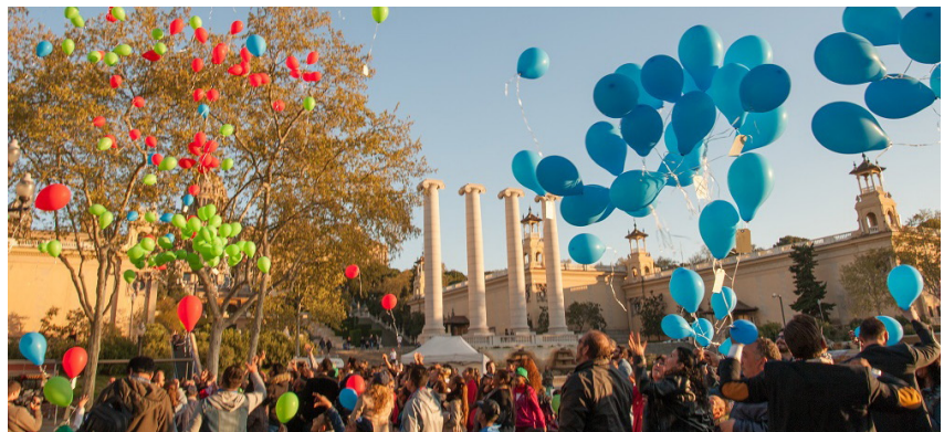
Fiesta del Día Internacional del Gitano en Barcelona

Después de estos actos tan emotivos, por la tarde se disfrutó de algunas de las celebraciones típicas de los gitanos. A las 18h tuvo lugar un Festival de Rumba Catalana en el Conservatorio del Liceo, donde las palmas y la guitarra flamenca fueron las protagonistas. A continuación se llevó a cabo una performance teatral en el mismo espacio, con Seo Cizmic y acompañamiento musical de Gennaro Spinelli. El día culminó con cuadro flamenco, uno de los símbolos más característicos de la cultura gitana.