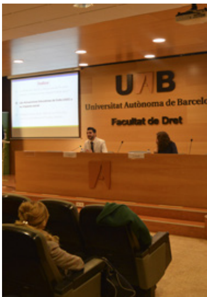
Día Internacional del Gitano en la UAB

A este acontecimiento le siguió la ceremonia floral en el río Besòs. Las ofrendas florales en los ríos son un ritual muy conocido en la comunidad romaní con una gran carga simbólica. El acto consiste en lanzar flores y velas encendidas al río en homenaje a las víctimas gitanas de la Segunda Guerra Mundial. Para los gitanos esta tradición supone recordar la decisión que tomó su pueblo de abandonar la India y comenzar un éxodo por todo el mundo, fluyendo como un río.